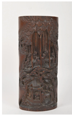
54 CHINE Vers 1900 Important pot à pinceau en bambou sculpté de lettrés dans des pavillons dans une forêt de bambous. (gerces). H. : 30 cm.