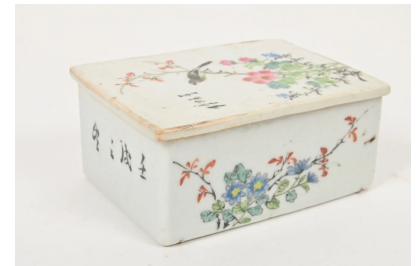
63 CHINE XXe siècle

Boîte rectangulaire couverte en porcelaine émaillée polychrome à décor d'oiseaux et caractères. Au revers, la marque apocryphe de Qianlong. Dim. 5 x 11,5 x 8,5 cm.