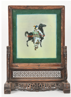
79 CHINE Moderne Fixé-sous-verre représentant un cavalier et son cheval. Monté en écran en bois sculpté. Dim. totales : 51,5 x 38 cm.