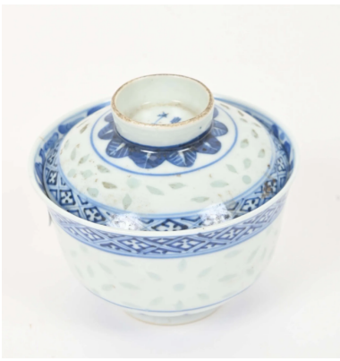
46 CHINE Début XXe siècle

Petit bol couvert en porcelaine à décor en bleu sous couverte et grains de riz, de lotus, nuages et frise de losanges. Au revers, la marque apocryphe de Kangxi. H. : 9,5 cm. Diam. : 12 cm.