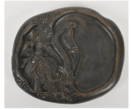
80 CHINE Moderne Pierre à encre à décor d'un dragon. 19,5 x 16,5 cm.