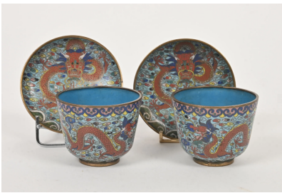
71 CHINE XXe siècle

Deux petits bols et leurs sous-tasses en bronze et émaux cloisonnés à décor de dragons dans les nuées sur fond bleu.