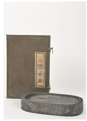
56 CHINE XXe siècle

Pierre à encre de forme ovale en bois partiellement doré à décor d'enfants. Dim. 22,5 x 14,5 cm.