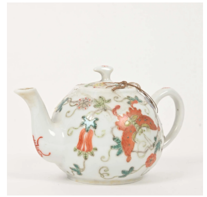
45 CHINE Début XXe siècle Petite verseuse en porcelaine à décor émaillé polychrome de papillons dans des vrilles de courges. Au revers, la marque apocryphe de Qianlong. H. : 6,5 cm.