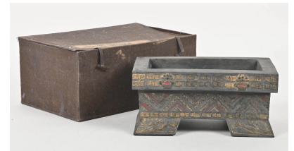
57 CHINE XXe siècle Jardinière quadripode partiellement doré et rouge à décor archaïsant. Dim. 10,5 x 23,5 x 14,5 cm.