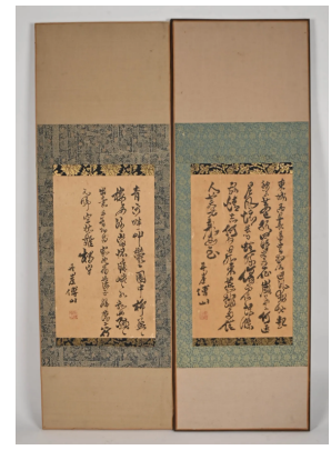
74 Chine Paire de poèmes calligraphiés sur papier, montés sur une toile. Dim. totales : 114 x 38 cm.