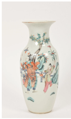
41 CHINE Fin XIXe siècle Vase de forme balustre en porcelaine à décor émaillé polychrome de dignitaire en armure et enfants. Au revers, la marque apocryphe de Tongzhi. H. : 23 cm.