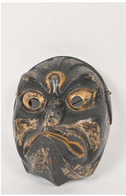
102 JAPON XXe siècle

Masque de gigaku en bois laqué noir et doré, figurant Garuda. H. 25 cm.