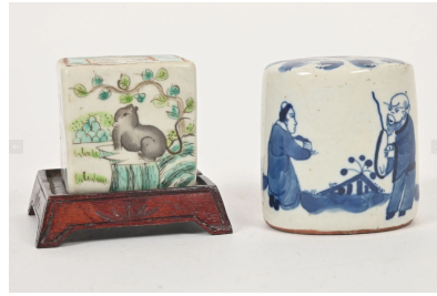
60 CHINE XXe siècle

Deux cachets en porcelaine : l'un à décor bleu blanc d'un sage, forme ovale, le second cubique à décor polychrome d'animaux.