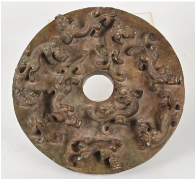
76 CHINE XXe siècle

Disque bi en plâtre imitant la néphrite à décor en bas-reliefs sur les deux faces de chilong. H. : 50 cm.