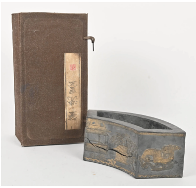
58 CHINE XXe siècle

Jardinière en forme d'éventail en bois noirci et doré de dignitaire et char sur une face et pavillon sur l'autre (fente) Dim. 9 x 25,5 x 11 cm.