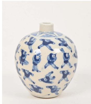
61 CHINE XXe siècle

Petit vase boule en porcelaine bleu blanc à décor aux cent garçons. H. : 7,5 cm.