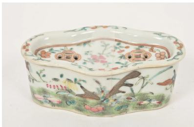
47 CHINE Vers 1900 Porte-savon en porcelaine émaillée polychrome et or de forme polylobée à décor de papillons et fleurs. Dim. 4 x 12,5 x 7,5 cm.