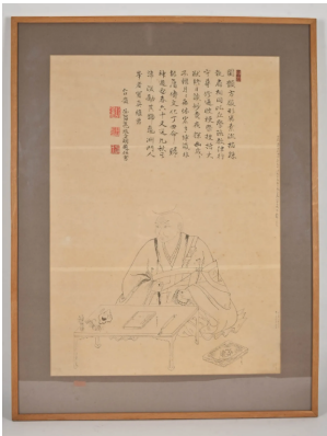
103 JAPON XXe siècle

Portrait de lettré Encre A vue : 77 x 56 cm.