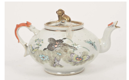
51 CHINE Début XXe siècle Verseuse en porcelaine à décor émaillé polychrome et or de papillons, la prise formant chimère. L. : 19,8 cm.