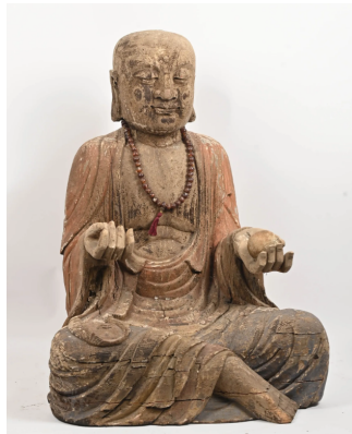
73 CHINE Vers 1900 Luohan en bois et traces de polychromie assis en padmasana, les yeux mi-clos, en méditation. (Gerces) H. : 89 cm.