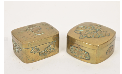
95 JAPON Epoque MEIJI (1868 - 1912) Deux boîtes en bronze dépatiné, l'une carrée à décor de loir dans la vigne, l'autre rectangulaire à décor de rocher de lettré, pin, grenades et oiseaux en vol. H. : entre 2,5 et 3 cm.