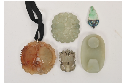
69 CHINE XXe siècle

Ensemble de quatre groupes, trois en néphrite céladon comprenant une plaque sculpté d'une chauve-souris, une pêche et un phénix, un en jadéite verte et émail peint en forme de feuille et un en cornaline de deux poissons.