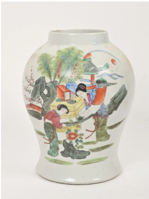
59 CHINE XXe siècle

Potiche balustre en porcelaine à décor polychrome de deux femmes admirant une peinture. (Manque le couvercle) H. : 33 cm.