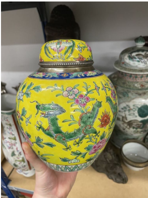
77 CHINE Moderne Pot à gingembre en porcelaine émaillée polychrome à décor de dragons et végétaux sur fond jaune. Poids brut : H. : 18 cm. Monture en argent 950/1000e, poinçon Minerve.