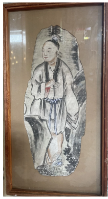
72 CHINE Fragment de peinture polychrome sur stuc, personnage se tenant debout près d'un rocher, son vêtement orné d'une ceinture bleue. Dim. 47 x20 cm.