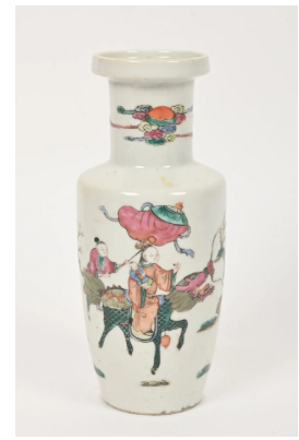
50 CHINE Début XXe siècle

Vase en porcelaine à décor émaillé polychrome d'une immortelle sur une qilin accompagnée d'enfants tenant des bannières et des gong. H. : 24 cm.