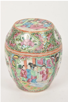
40 CHINE, Canton Fin XIXe siècle Boîte couverte en porcelaine émaillée polychrome et or à décor de personnages dans un entourage de végétaux stylisés et papillons. H. : 12 cm.