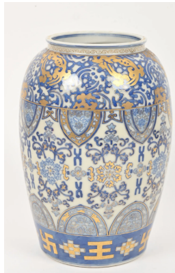
92 Japon XIXe , époque Meiji Vase balustre en porcelaine à décor de végétaux stylisés en bleu rehaussé d'or. Marque sous la base. H. : 27 cm.