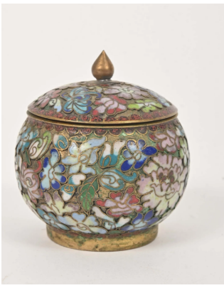
64 CHINE XXe siècle

Petite boîte couverte en bronze doré et émaux champslevés percé de fleurs. H. : 8 cm.