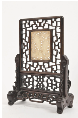
55 CHINE Début XXe siècle Petit écran en bois ajouré orné d'une plaque en néphrite céladon aouré des frères Hehe debout parmi les rinceaux. (Accidents au socle). Dim. plaque 6,4 x 4,7 cm. Dim. totale 19 x 13 cm