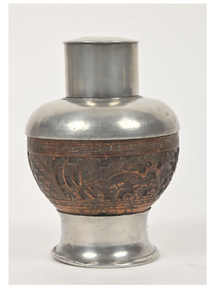
43 CHINE Fin XIXe siècle Boîte à thé sur piédouche en métal et noix de coco sculptée de branches de cerisier, pins et bambous. H. : 13 cm.