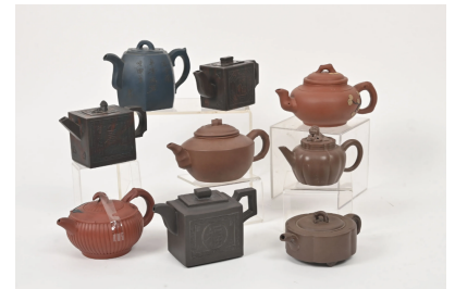
84 CHINE, Yixing XXe siècle Ensemble de neuf verseuses en grès de diverses formes.