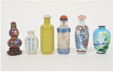
70 CHINE XXe siècle

Ensemble de cinq flacons tabatières, l'un cylindrique en overlay bleu et peint à l'intérieur, un en émail de chrysanthèmes, un en porcelaine à décor en rouge de cuivre et bleu sous couverte d'acteur de théâtre, un en porcelaine aplati et un en porcelaine craquelé jaune.