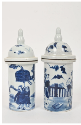
66 CHINE XXe siècle

Paire de vases cylindriques couverts en porcelaine blanc bleu à décor d'enfants et lettrés sous des nuées. H. totale : 17 cm.