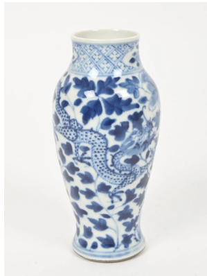
42 CHINE Fin XIXe siècle Petit vase de forme balustre en porcelaine à décor en bleu sous couverte d'un dragon dans les chrysanthèmes et les pivoines. H. : 15 cm.