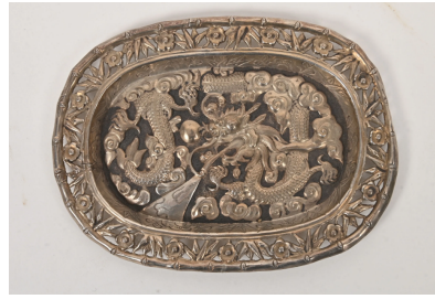
106 VIETNAM Vers 1900 Petit plateau ovale probablement en argent (=> à tester) repoussé, à décor de dragons dans un entourage de nuées, le rebord ajouré d'une frise de fleurs de cerisier. Dim. 10,5 x 8 cm. Poids brut : 27,23 g.