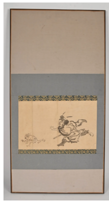
91 JAPON XIXe siècle Encre sur papier, Shoki poursuivant un démon. (trous, pliure) Monté en panneau vertical. Dim. totales : 99 x 51 cm.