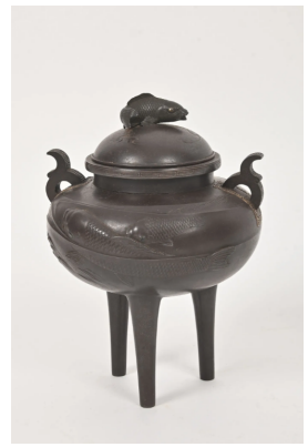
94 JAPON Epoque MEIJI (1868 - 1912) Brûle parfum tripode en bronze à patine brune à décor de carpes nageant flanqué de deux anses et frises de grecques, la prise formant carpe. H. : 17 cm.