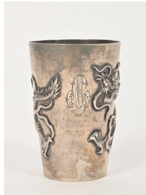
49 CHINE Vers 1900 Gobelet en argent à décor en relief de dragons et chiffre MC. Marque W.H (Wang Hing & co) et 90. H. : 8,5 cm. Poids : 107,25 g.