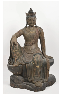
75 CHINE XXe siècle Guanyin en bois polychrome assise en rajalilasana, la main droite reposant sur le genou. (Gerces) H. : 73 cm.