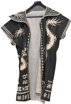
86 CHINE XXe siècle

Trois tuniques brodées dorée, dont une huilée avec plumes de coqs.