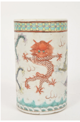
52 CHINE Début XXe siècle

Pot à pinceau en porcelaine émaillée polychrome à décor de cinq dragons. Au revers, la marque apocryphe de Shunzhi. (Fêle) H. : 13 cm.