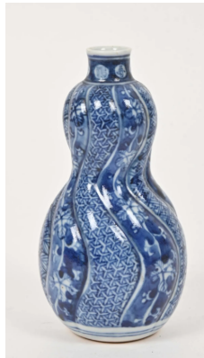
67 CHINE et Japon XXe siècle

Deux porcelaines à décor en bleu sous couverte : - Tokkuri de forme double gourde à décor de motifs géométriques dans des frises verticales. Japon. H. - Plateau rectangulaire à décor de pivoines, rochers et chauve-souris. Dim.