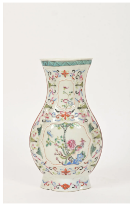
78 CHINE Moderne Vase de forme balustre quadrilobée à panse aplatie à décor émaillé polychrome de phénix et végétaux en haut relief. H. : 30 cm.