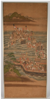
90 JAPON Epoque EDO (1603 - 1868), XIXe siècle Encre et couleurs sur papier, guerriers sur un bateau face à des démons. Non signé. (trous, restauration) Dim. 124 x 56 cm.