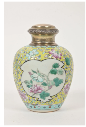
68 CHINE XXe siècle

Vase balustre en porcelaine émaillé polychrome à décor de pivoines en réserve sur fond de rinceaux de pivoines et fond jaune. H. : 13 cm. Le col monté en argent poinçon Minerve. Poids brut : 481,26 g. Estim. 100/120 €