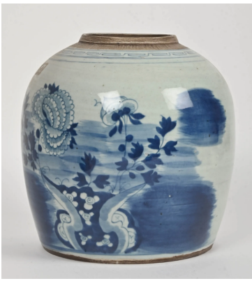
39 CHINE Fin XIXe siècle Pot à gingembre en porcelaine à décor en bleu sous couverte de pivoines et frise de grecques. (manque le couvercle) H. : 22,5 cm.