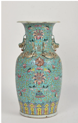
53 CHINE Vers 1900 Vase de forme balustre en porcelaine émaillée bleu turquoise à décor de rinceaux de fleurs de lotus, grenades et caractères 'shou' (longévitité), les anses en forme de chimères appliquées. (Très accidenté). H. : 35,5 cm.