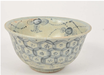
65 CHINE XXe siècle

Vase balustre en porcelaine émaillé polychrome à décor de pivoines en réserve sur fond de rinceaux de pivoines et fond jaune. H. : 13 cm. Le col monté en argent poinçon Minerve. Poids brut : 481,26 g. Estim. 100/120 €