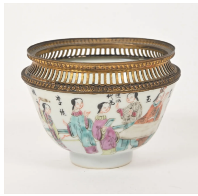
48 CHINE Début XXe siècle

Bol en porcelaine à décor émaillé polychrome de femmes de cour. Au revers, la marque apocryphe de Tongzhi. H. : 8 cm. Monté en laiton doré.