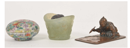
62 CHINE XXe siècle

Ensemble comprenant une petite boîte couverte en porcelaine à décor de fleurs, un petit vase en pierre dure, une balle en métal et un sujet en cuivre : lettré.